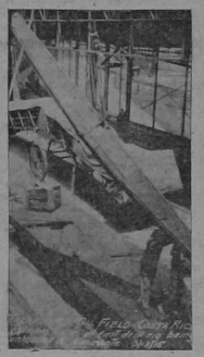
Una de las piezas de gran tamaño de la máquina petrolera. Su transporte es muy difícil y costoso.