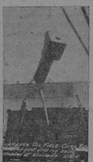
En un cañón de largo alcance se la caldera de la perforadora de pozos de petróleo que llega a hacer la conquista industrial de las selvas de Talamanca.