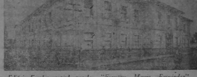
Edificio Escolar ocupado por las 'Escuelas Mauro Fernández'

Competente Maestra Normal, ha cuya dirección se encuentra la Escuela de Párvulos Número Uno, que visitamos ayer.