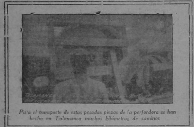
Para el transporte de estas pesadas piezas de la perforadora se han hecho en Talamanca muchos kilómetros de caminos

El tipo de la maquinaria recibida de la semana pasada pertenece al tamaño mayor del "Star Drill" y puede perforar hasta la profundidad de 2,400 pies. La caldera sólo tiene un