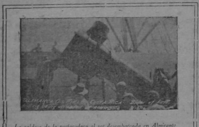
La caldera de la perforadora al ser desmontada en Almirante